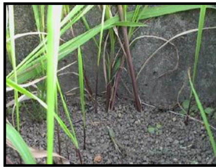
葉鞘の白粉：左の写真はケナシで白粉が有る、右の写真はフシゲで白粉が無い。