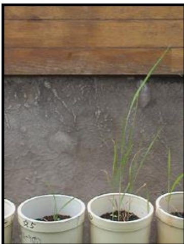
実生の初期生育：播種後1年目の実生。