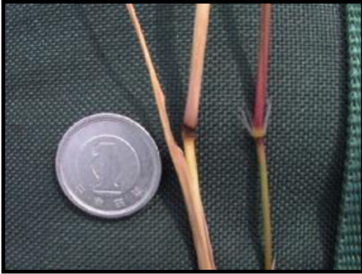
開花稈の節毛：左はケナシで毛がない、右はフシゲで毛が有る。