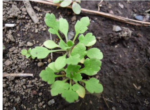
実生. 葉の表面に立毛があるのが特徴.