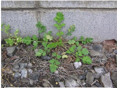
冬の間はロゼットで過ごす.