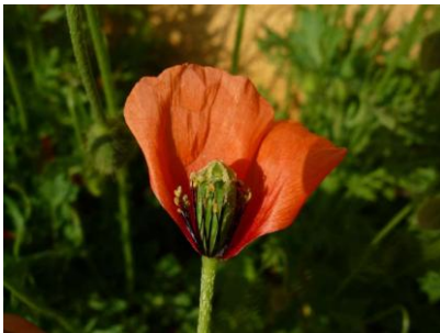
花の断面. ヒナゲシに比べ、子房が細長い.