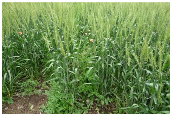
写真-1 コムギ畑に侵入したナガミヒナゲシ

日本では1961年に東京で確認されたのが最初の記録である。輸入穀物から種子が検出されており 1) 、非意図的な導入であったとみられるが、1990年代から急速に分布域が広がり、現在では北海道から九州まで広い範囲で確認されている 6) 。