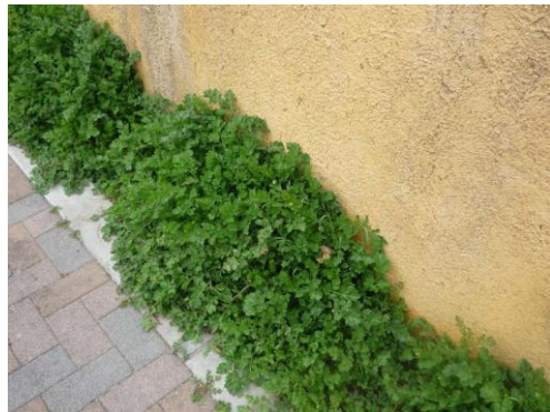
都市部では、舗装道路の縁や砂利敷の駐車場、公園などに多くみられる.