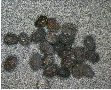
種子. 表面に網目模様がある.