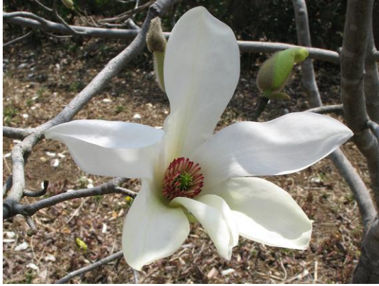
コブシの花. 赤く見えるのは雄蕊.