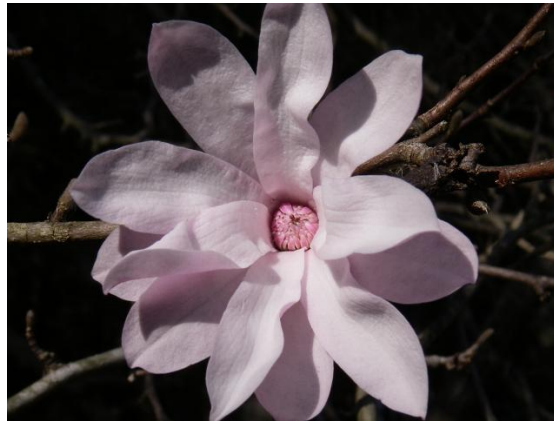
シデコブシは、東海地方にのみ自生する、コブシの近縁種. 花卉の数が多い.