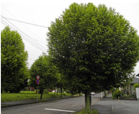
街路樹として植栽されているコブシ