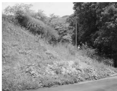
写真-1 地域性種苗を導入した斜面緑化の事例

自然環境調査では、特に動植物調査をはじめ、猛禽類調査などの分野をカバーしています。技術的な部分では、夜行性動物などの確認の困難な分類群(夜行性動物など)の観察手法の工夫に重点を置き、無人撮影、テレメトリー調査など効果的な情報収集をおこなっています。また、これらの技術を駆使した鳥獣害対策にも力を入れています。猛禽類では、事業の進捗を考慮しつつ効率的な調査を実施するほか、様々な状況に応じた観察手法や無人撮影、GISを用いた営巣地評価などをおこなっています。