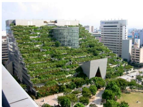
写真-1 アクロス福岡 ステップガーデン