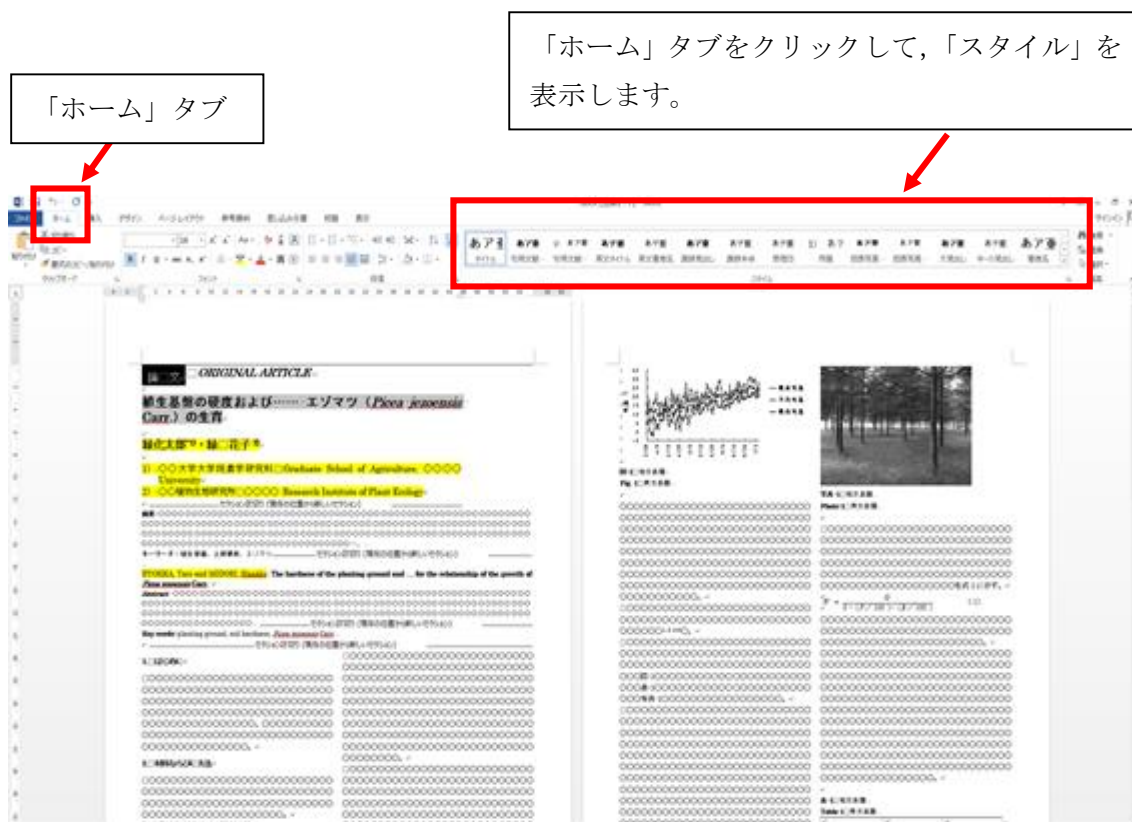
図-1 スタイルの場所 (Word 2013 の例を示しています)